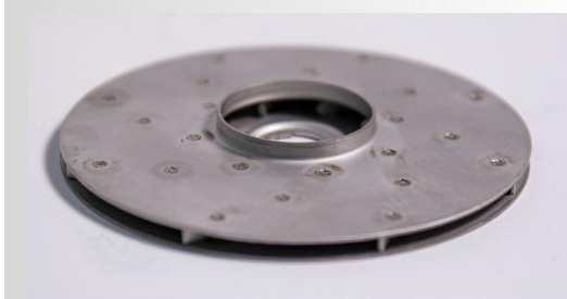
Turbina din inox