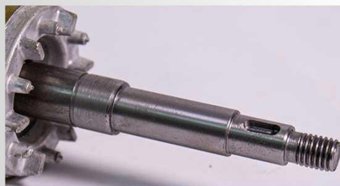
Ax pompa din inox