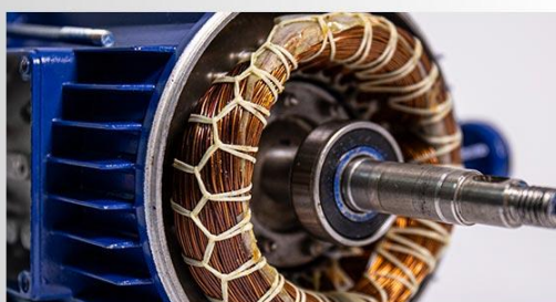
Infasurare stator din cupru

Specificatii tehnice: Pompa centrifugala multietajata din inox Wasserkonig PCM7-53