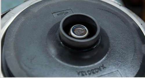
Turbina din PPO (techno-polymer)

Specificatii tehnice: Hidrofor cu pompa autoamorsanta Wasserkonig 25LM4.3-48