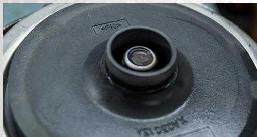
Turbina din PPO (techno-polymer)