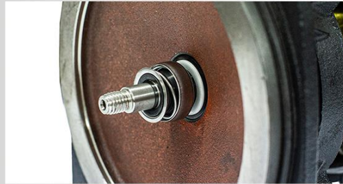
Garnitura mecanică: ceramică/grafit/NBR