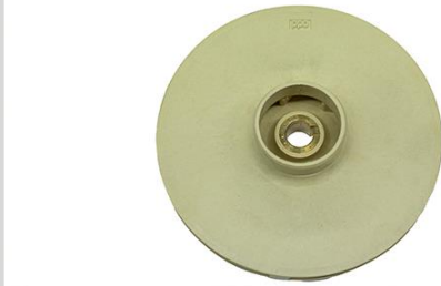
Turbina din PPO(techno-polymer)