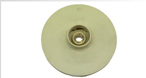
Turbina din PPO(techno-polymer)