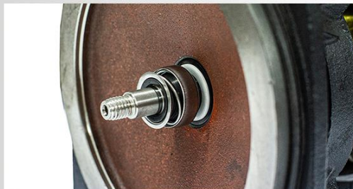
Garnitura mecanică: ceramică/grafit/NBR