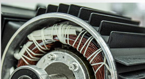
Carcasa motorului din aliaj de aluminiu