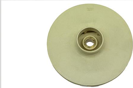
Turbina din PPO(techno-polymer)