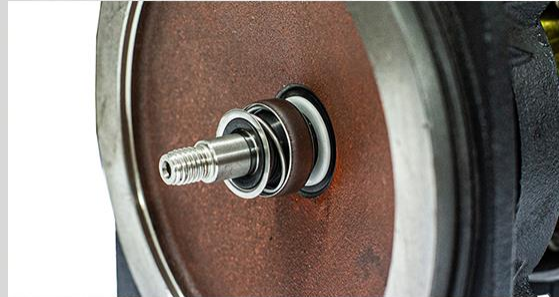
Garnitura mecanică: ceramică/grafit/NBR