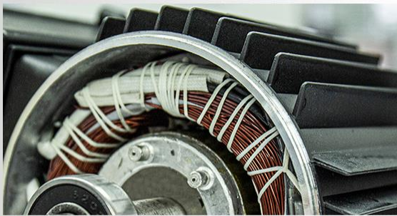
Carcasa motorului din aliaj de aluminiu

Specificatii tehnice: Hidrofor cu pompa autoamorsanta Wasserkonig WSKX5154-50