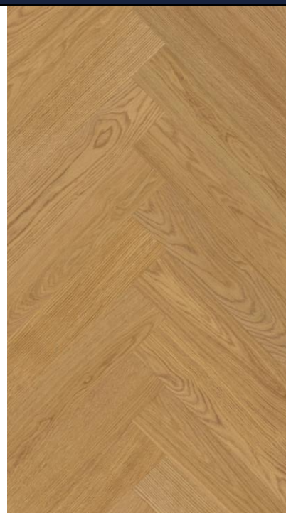
STEJAR ANTIC HB

SW4HMX-FHLA1-DP5XXX-ESILA EAN: 5907461809737 NR.CATALOG: DP5000029