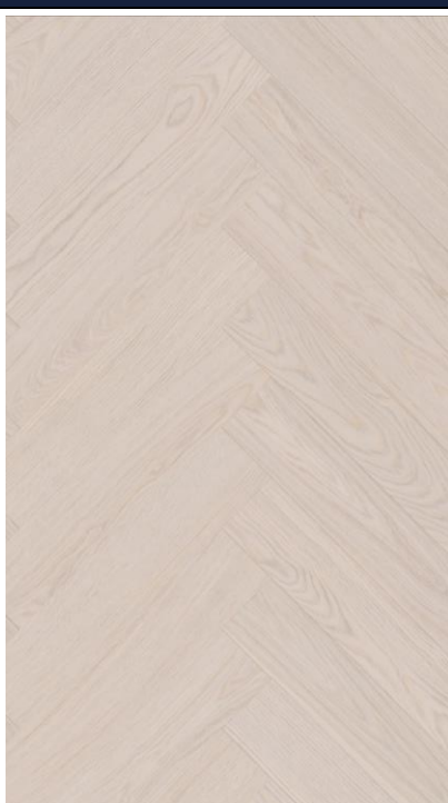
STEJAR SILK HB

SW4HMX-FHLA1-DP5XXX-EFLAA EAN: 5907461809690 NR.CATALOG: DP5000025