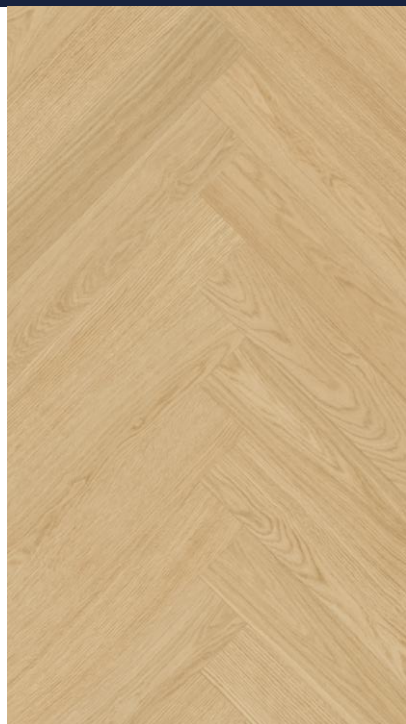
STEJAR CREAM HB

SW4HMX-FHLA1-DP5XXX-ECREA EAN: 5907461809799 NR.CATALOG: DP5000035