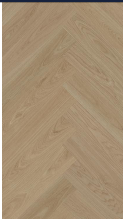
STEJAR FLAX HB

SW4HMX-FHLA1-DP5XXX-EFLAA EAN: 5907461809690 NR.CATALOG: DP5000025