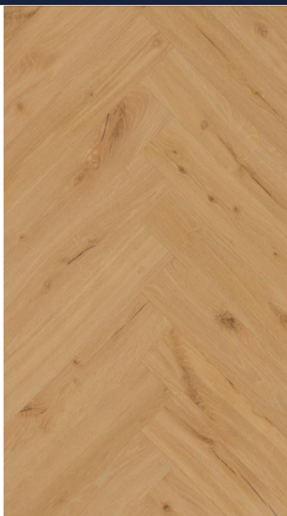
STEJAR GINGER HB

SW4HMX-FHLA1-DP5XXX-ECREA EAN: 5907461809799 NR.CATALOG: DP5000035