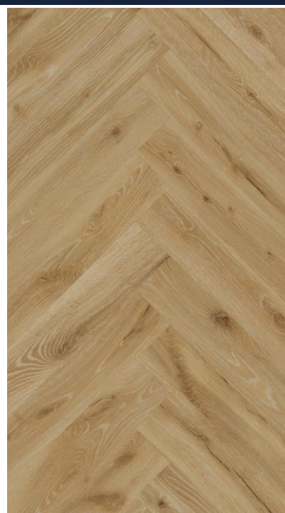
STEJAR DESERT HB

SW4HMX-FHLA1-DP5XXX-EGINF EAN: 5907461809713 NR.CATALOG: DP5000027