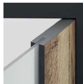
îmbinare cu sticlă