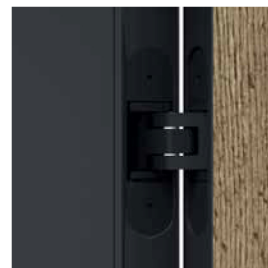
balamale 3D în culoarea tocului