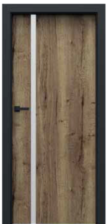
model 4.A disponibil și cu sticlă neagră