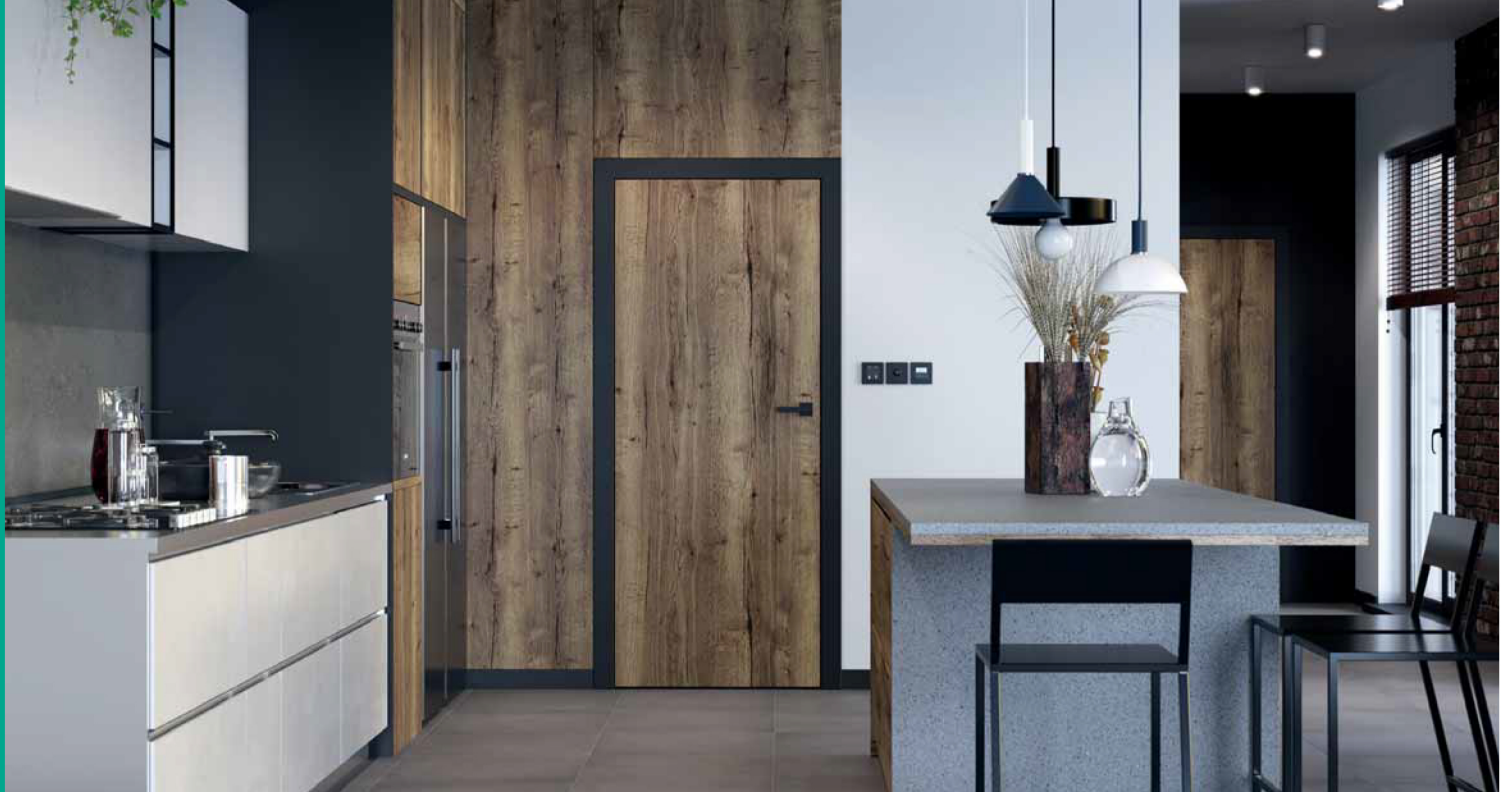
PORTA LOFT, 1.1, Halifax Tabak, mâner ELEGANTO negru