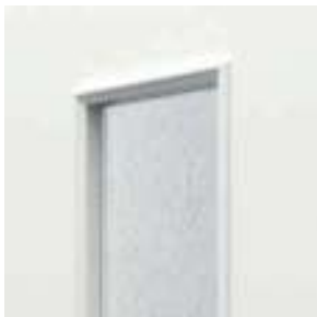
panou cu sticlă

Modele disponibile într-o varietate de nuanțe RAL. Pentru mai multe detalii întrebați în magazine.