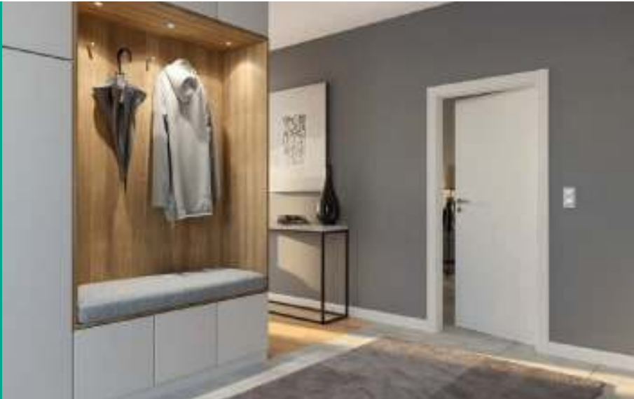
MINIMAX P, Alb