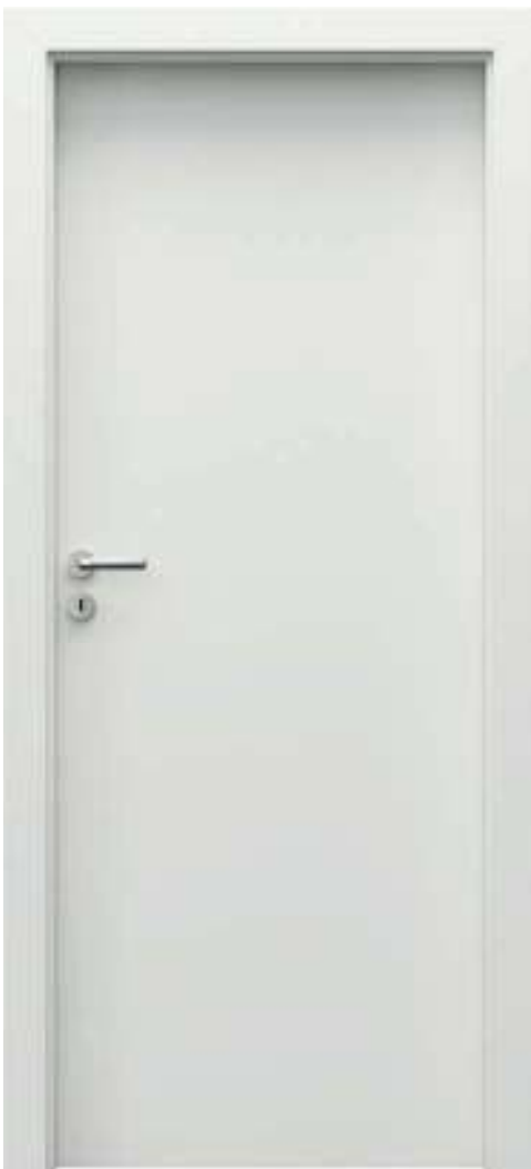
MINIMAX P, Alb