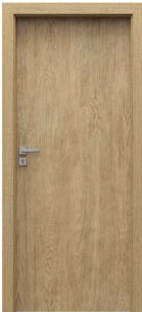
Natura CLASSIC 1.1, Stejar 1, Floare