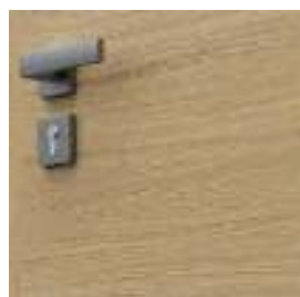
striaiții orizontale grupa 7

Specificitatea furnirului natural poate determina diferențe de nuanțe și distribuire a striaiților pe suprafața finisajului. Aceste caracteristici ale finisajului nu sunt considerate defecte ale produsului.