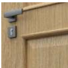
ramă ornamentală grupa 5