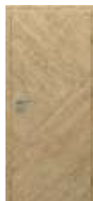
model 3.1 striații oblice