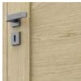
panou plan – model B.0