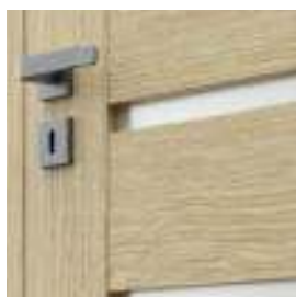
ramă cu sticlă mată – model A.9