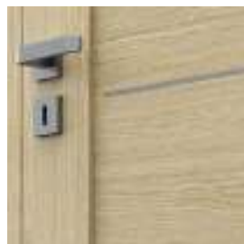
insertii – model D.0