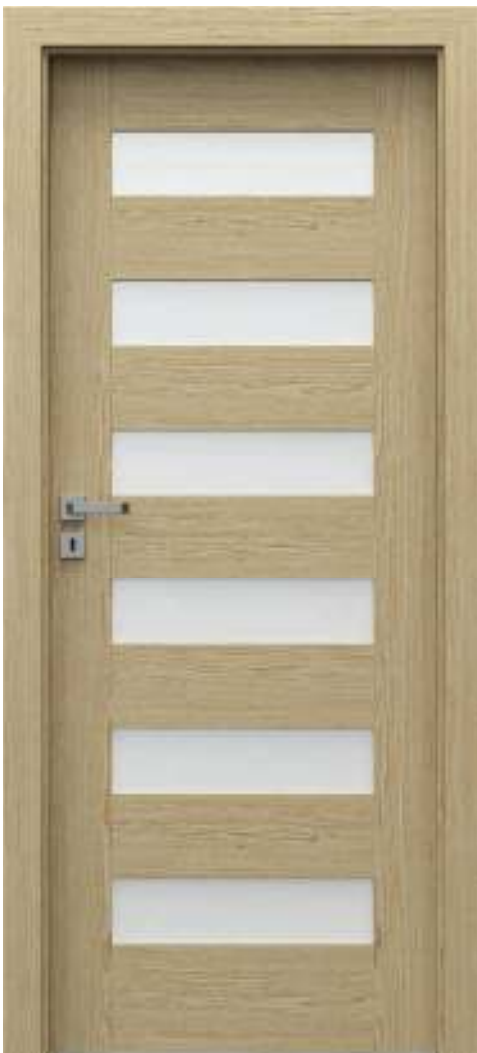
Natura CONCEPT C.6, Stejar