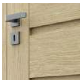
panou plan – model A.0

Specificitatea furnirului natural poate determina diferențe de nuanțe și distribuire a striățiilor pe suprafața finisajului. Aceste caracteristici ale finisajului nu sunt considerate defecte ale produsului.