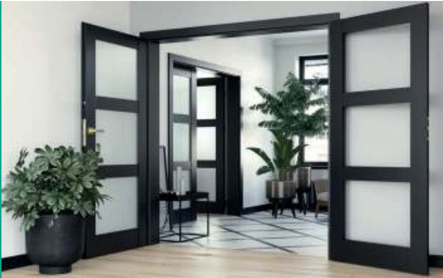
Natura GRANDE B.3, Negru