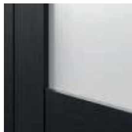
ramă cu sticlă