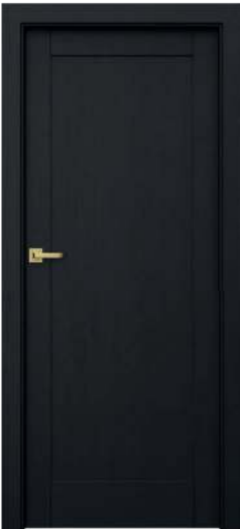
Natura GRANDE A.0, Negru