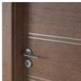
insertii culoare argintie