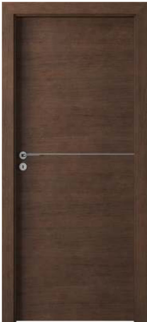
Natura LINE F.1, Mocca