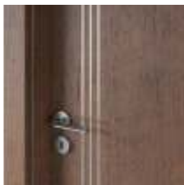
insertii culoare argintie