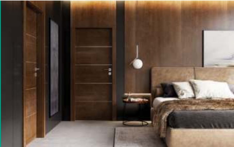
Natura LINE E.2, Mocca