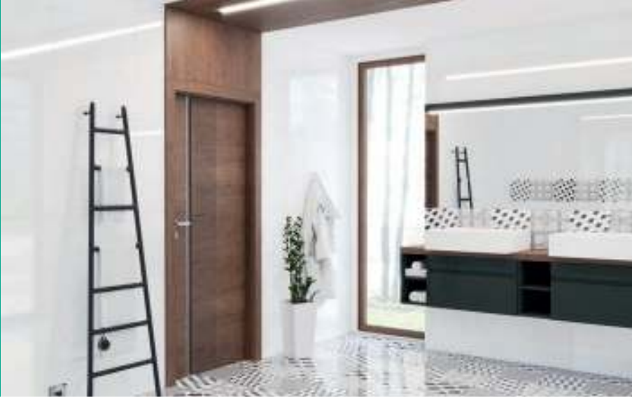
Natura SPACE 7, Stejar Brun