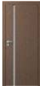
model G.1 disponibil și cu sticlă neagră