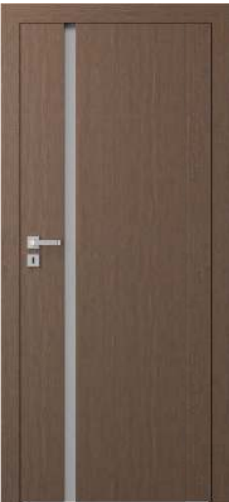
Natura SPACE 4, Stejar Brun