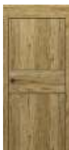
model C.2 cu inserții deco- rative și toc cu panou de 20 cm.