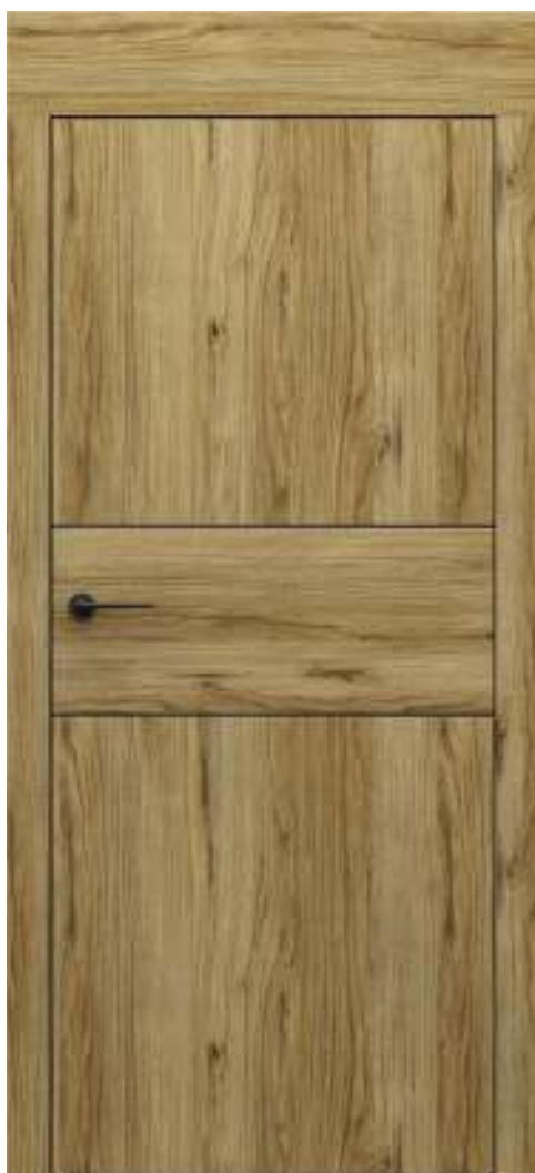
Porta LEVEL C.2 cu inserții decorative, Stejar Catania, Toc cu panou de 20 cm.