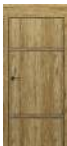
model C.3 cu inserții decorative și toc cu panou de 20 cm.