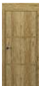
model C.1 Toc LEVEL cu panou de 20 cm