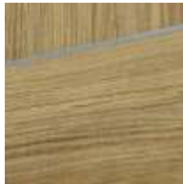
insertii decorative argintii