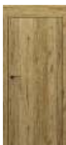
Porta Decor model P vezi pag. 66