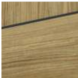
insertii decorative negre