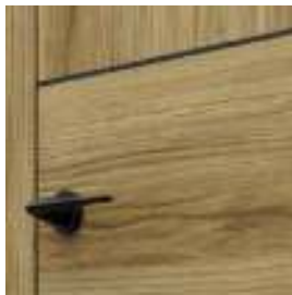
toc dedicat LEVEL

Colecția Porta LEVEL beneficiază de tocul dedicat LEVEL. Panoul are dispunere pe verticală sau pe orizontală - se aplică pentru selecția de 5 culori.