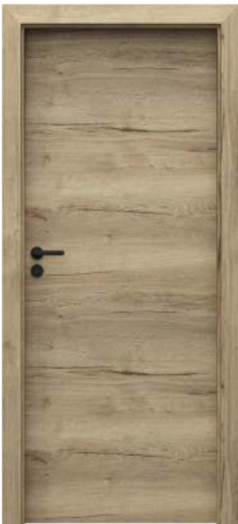
Porta RESIST 7.1, Halifax Natural