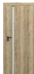
model 4.A disponibil și cu sticlă neagră