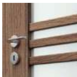
ramă cu sticlă