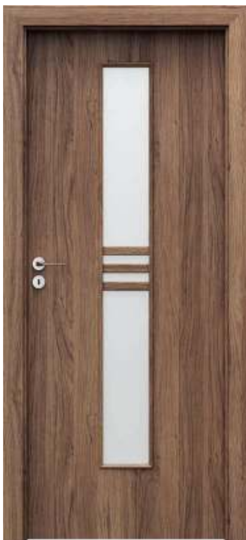
Porta STIL 1, Stejar California