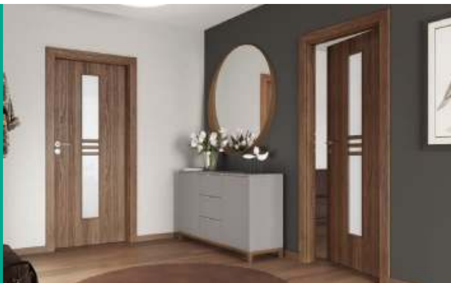
Porta STIL 1, Stejar California