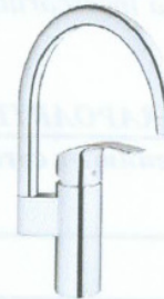
Baterie monocomandă EUROSMART