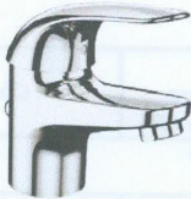
Baterie monocomandă EUROECO