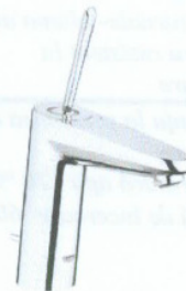
Baterie monocomandă EURODISC JOYSTICK