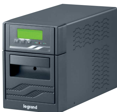
3 100 06

UPS Convențional / Line interactive / Monofazat