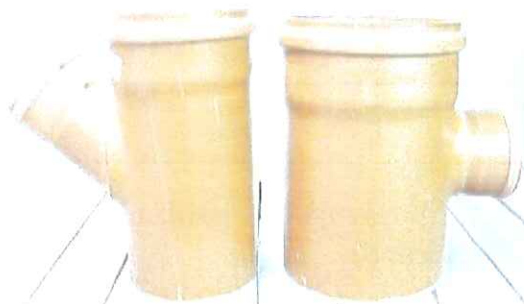
Vedere generală piesă de inspecție canalizare din PVC.