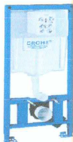
Modul Rapid SL pentru WC