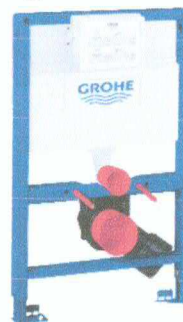
Modul SOLIDO pentru WC