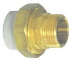
mufa cu olandez FE