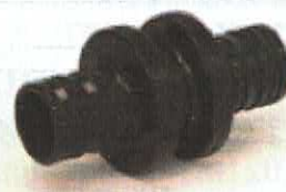
Corp mufă redusă din PPSU pentru țevi cu diametrele (în mm) 20-16, 25-20, 25-16 și 32-25.