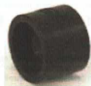
Corp mufă egală din PPSU pentru țevi cu diametrul (în mm) 16, 20, 25 și 32.

Manșonul alunecător care glisează la exteriorul teii, este compatibil cu țevi cu diametrul (în mm) 16, 20, 25 și 32.