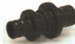
Corp cot din PPSU, la 90°, pentru țevi cu diametrul (în mm) 16, 20, 25 și 32.