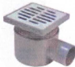
Sifon pardoseală cu o ieșire D50mm