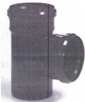
Ramificație la 87° fonoizolantă