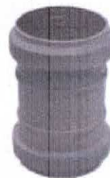
Manson din PP

l) manson din PP în gama de dimensiuni De 32, 40, 50, 75, 110, 125 și 160mm;