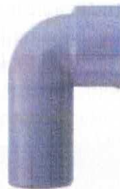
Curba tehnică fără dop

o) curba tehnică cu dop fără garnitură pentru racordare obiecte sanitare din PP în gama de dimensiuni De 32 și 40 mm;