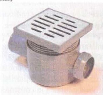
Sifon pardoseală cu o intrare D40mm și o ieșire D50mm