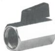
Robinete mini filet interior-filet interior, ½"