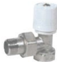
Robinet tur unghi

Cap termostat pentru robinet radiatoare: