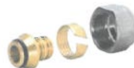
Adaptor pentru tevi din plastic

- Adaptoare pentru tevi din plastic (PE-X, PE-RT, etc) cod 220, 220A, 220E, pentru tevi din plastic, cu diam.: \varnothing 12 \div \varnothing 22 cu derivatii \varnothing 1/2'' , respectiv \varnothing 3/4'' G Eurocon.