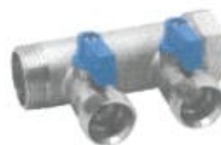
Colector D.1"cu 2 circuite eurocon si robinete