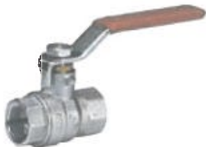
Robinete filet interior-filet interior cu parghie