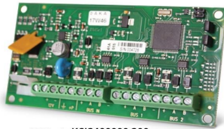
PCBA opis KSI2400000.300

Stație de alimentare cu energie electrică supravegheată